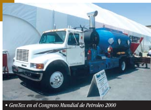
• GenTex en el Congreso Mundial de Petroleo 2000