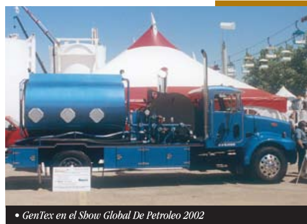
• GenTex en el Show Global De Petroleo 2002

Para más información, por favor comuníquese con: GenTex Oilfield Manufacturing Inc.