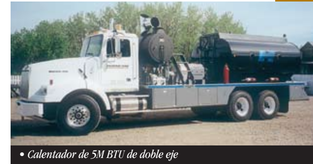
• Calentador de 5M BTU de doble eje