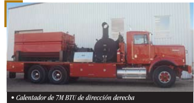
• Calentador de 7M BTU de dirección derecha