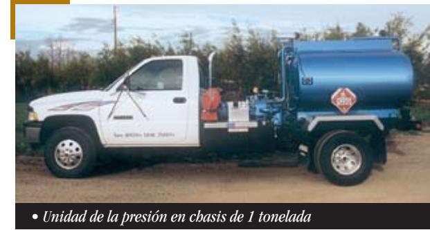
• Unidad de la presión en chasis de 1 tonelada