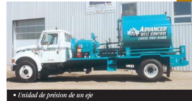
• Unidad de presión de un eje